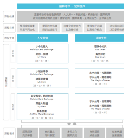
圖 2 102-103 學年國際教育校本課程架構